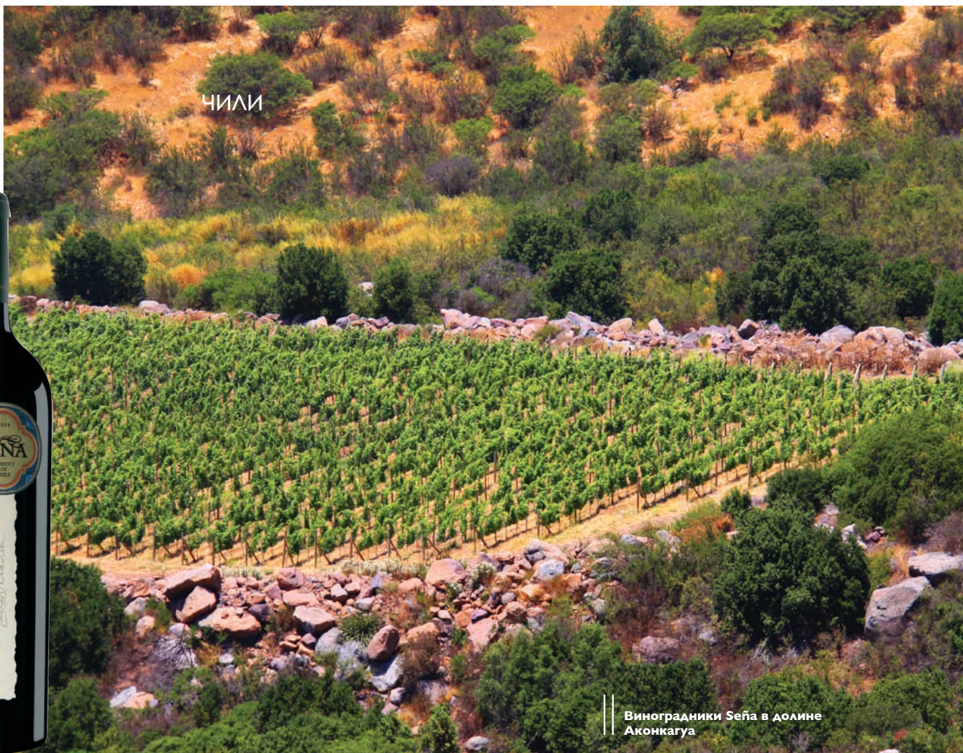
Виноградники Sena в долине Аконкагуа