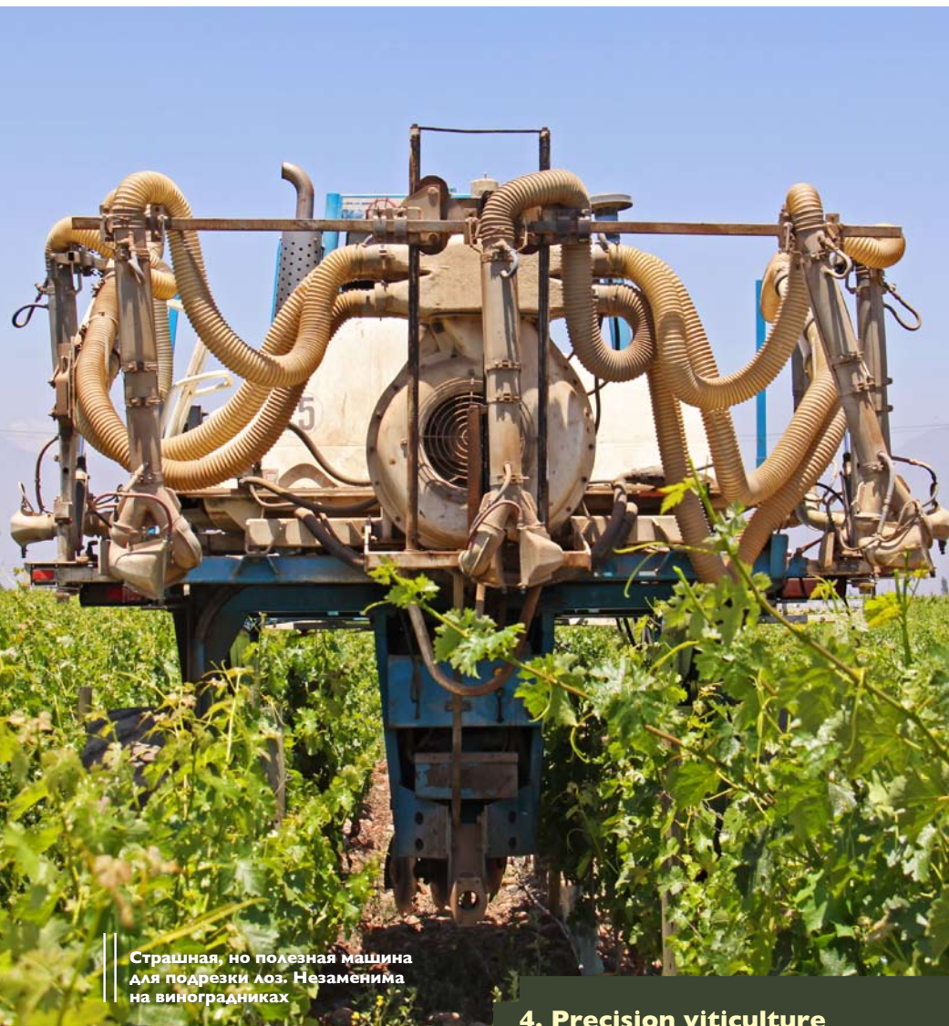
Страшная, но полезная машина для подрезки лоз. Незаменима на виноградниках