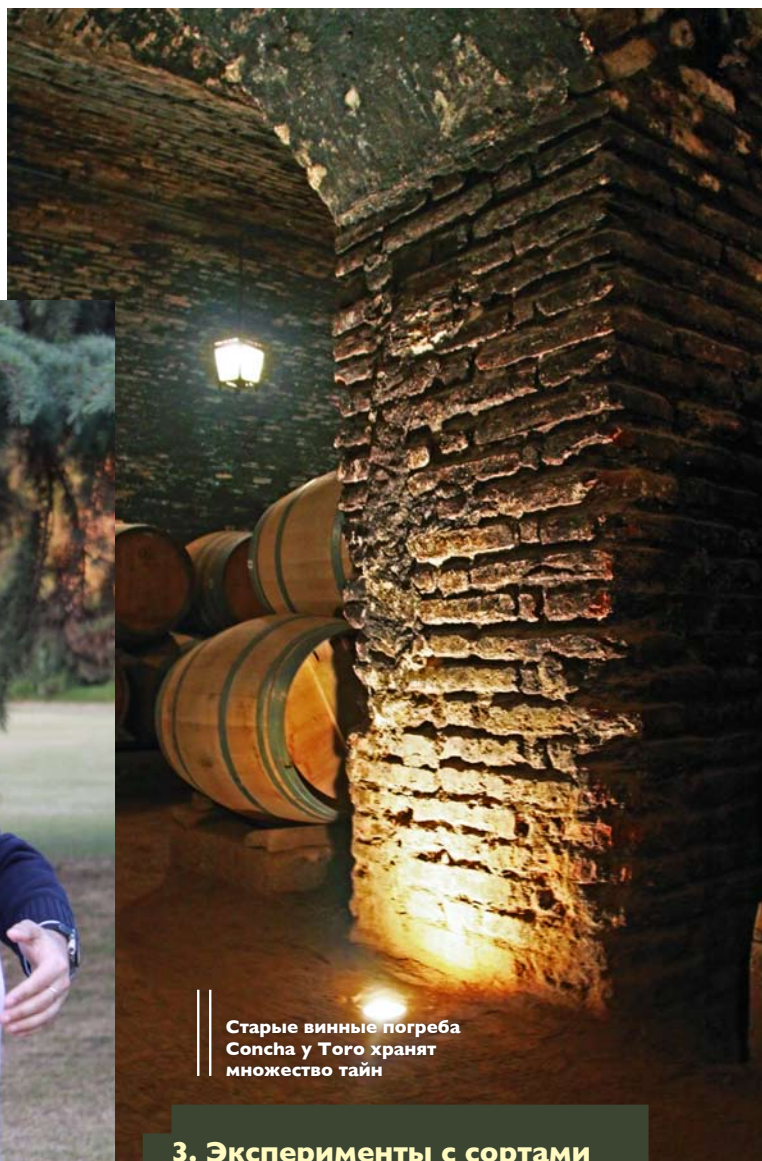
Старые винные погреба Concha y Toro хранят множество тайн