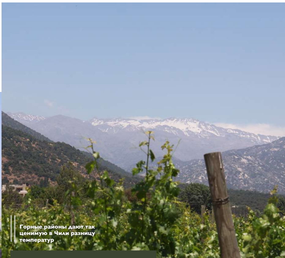
Горные районы дают так ценимую в Чили разницу температур

Первое чилийское вино, перешагнувшее психологический порог в 90 баллов, – Viña Santa Rita Chardonnay 1991. За ним последовали Viña Errázuriz Don Maximiano 1996 в 1998-м, Concha y Toro Don Melchor 1994 в 2001-м и Viña Carmen Cabernet 1995 в 1998-м. Casa Lapostolle отметила своим Clos Apalta уже в 1999 году и заработала 91 балл. Те самые норвежцы Odfjell получили дважды по 91 баллу за вино Odfjell Aliaga. В настоящий момент WS оценил почти 300 чилийских вин выше 90 баллов (многие – одни и те же вина разных годов уро-