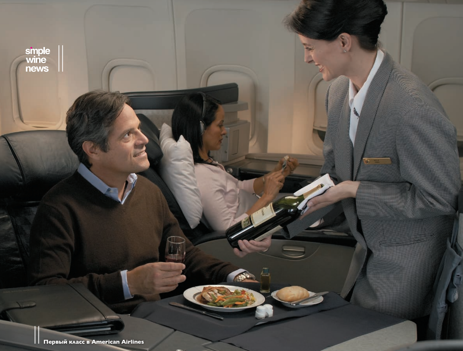
Первый класс в American Airlines