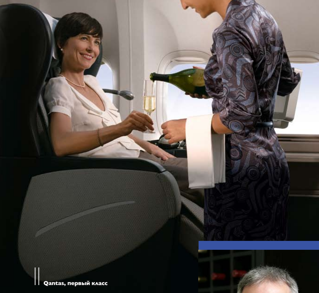
Qantas, первый класс